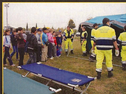
Carpaneta: Progetto scuola