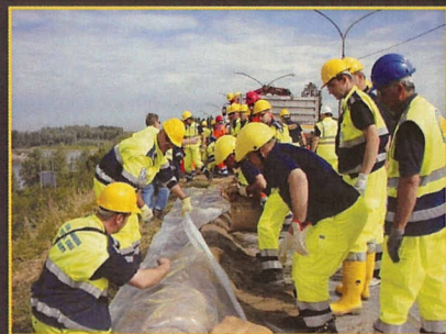
Ostiglia: Simulazione soprassoglio