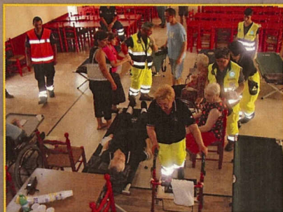
Serravalle a Po: Esercitazione antincendio