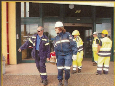
Ostiglia: Simulazione incendio supermercato