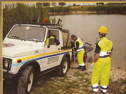
Ostiglia: Simulazione incendio motonave