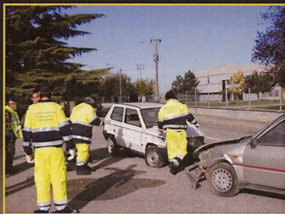
Sustinente: Simulazione incidente automobilistico