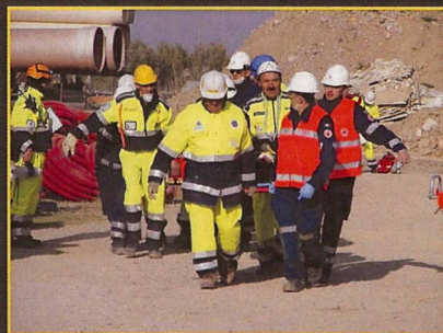
Villimpenta: Simulazione sisma