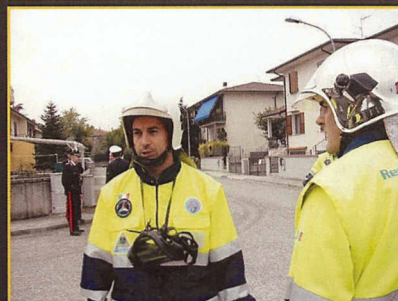
San Biagio: Simulazione fuga di gas